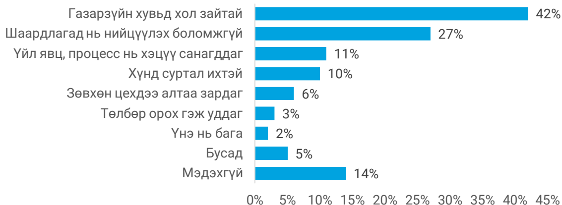
Зураг 3. Монгол банканд алтаа борлуулахгүй байх шалтгаан (n=371, олон хариулттай, нийт=443)

Зарим бичил уурхайчид Монгол банкнаас алт худалдаалсан төлбөр заримдаа удах тохиолдол байдаг гэж мэдээлсэн бөгөөд энэ нь албан ёсны худалдаанд оролцохоос татгалзах бас нэгэн шалтгаан байж болох юм. Орон нутагт хийсэн томилолтын ажиглалтаас харахад бараг бүх арилжаа нь бэлэн мөнгө эсвэл банкны шилжүүлгийн төлбөрөөр хийгддэг. Орон нутгийн худалдаачид буюу ченжүүдийн тусламжтай алтны эрх бүхий худалдаачдын хүртээмжийн асуудлыг хэсэгчлэн шийдэж болох боловч төлбөр удаашралтай байгаа нь магадгүй уурхайчдад саад учруулахгүй ч гэсэн арилжаачдад саад учруулах болно. Үүний сацуу бичил уурхайчдад Монгол банканд эсвэл НЦҮТ-т алтаа зарах үйл явцын талаар таниулж, давуу талынх нь талаар мэдээлэл түгээх шаардлагатай.