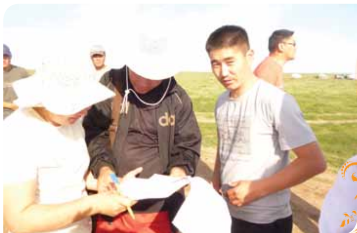
Зураг 52. Өнгөт чулууны олборлолтын газрын гэрээнд гарын үсэг зурж байна

Гар урлалын цех. Жонш, өнгөт чулуу болон Айраг сумын нутаг дэвсгэрт элбэг байдаг байгалийн чулуугаар гар урлал, бэлэг дурсгалын зүйл хийх, нэмүү өртөг шингэсэн бүтээгдэхүүн үйлдвэрлэх зориулалттай жижиг цех байгуулах санаачлагыг 2010 онд гаргасан бөгөөд энэхүү санаачлагыг хэрэгжүүлэхэд