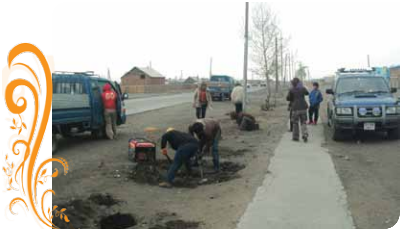
Зураг 34. Мод тарих нүх ухаж байгаа нь

ТББ-ын дэргэдэх “Авран туслах баг”. Бичил уурхайгаар ашигт малтмал олборлож байгаа иргэдийн хөдөлмөр хамгаалал, аюулгүй ажиллагаа, эрүүл ахуй, ажлын байрны аюулгүй орчинг бүрдүүлж ажиллахад нь туслалцаа үзүүлэх, хөдөлмөр хамгаалал, аюулгүй ажиллагааны дүрэм журмыг таниулах, мөрдүүлж ажиллуулах, бичил уурхайчдыг осол гэмтэл гаргахаас урьдчилан сэргийлэх зорилготойгоор Авран туслах баг байгуулан ажиллуулж байна. Тус баг 2009 оны 8-р сард ТБУТ, УУАА-ны дэмжлэгтэйгээр байгуулагдсан бөгөөд сумын хэмжээнд олборлолт явуулж байгаа газруудад сар бүр тогтмол явж үзлэг шалгалтыг хийж байна. Хөдөлмөр хамгаалал, аюулгүй ажиллагааны үзлэг шалгалтын дэвтэрийг тогтмол хөтөлж хэвшив. Мандал сумын Онцгой байдлын албатай сар бүр тогтмол сургалт авах гэрээ байгуулан сургалтанд хамрагдаж байна.