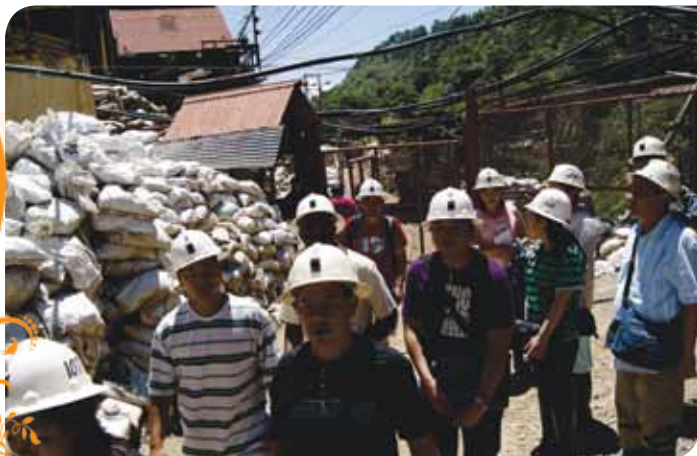
Зураг 78. Бэнгуэтийн бичил уурхайчдын уурхайн болон баяжуулах цехийн зохион байгууллалттай танилцаж байгаа нь