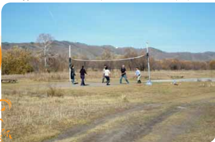
Зураг 100. Гар бөмбөгийн тэмцээн