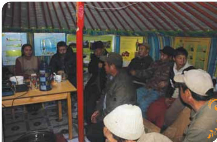
Зураг 9. ШХШО-ын стандартын тухай уулзалт ярилцлагын үеэр

Шударга худалдаа, шударга олборлолт. Хариуцлагатай уул уурхайн холбоо, Шударга худалдааны тэмдэгтийн байгууллагаас санаачлан боловсруулсан Шударга худалдаа, шударга олборлолтын стандартын шаардлагыг хангаж зөв зохистой, ёс суртахуунтай, нийгмийн болон байгаль орчны хариуцлагатай үйл ажиллагаа явуулснаар бидний өдөр тутмын үйл ажиллагаанаас илүү орлого олох, нийгэм, орон нутгийн хөгжилд бодит хувь нэмэр оруулах боломж байгаа гэдгийг