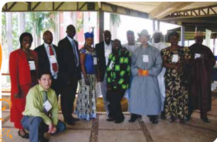
Зураг 65. CASM-ын 8-р хуралдаанд оролцогсод