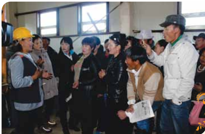
Зураг 97. Туршлага судлах аялалын багийнхан Төв аймгийн Борнуур сумын мөнгөн усгүй технологиор хүдэр баяжуулах цехийн үйл ажиллагаатай танилцав