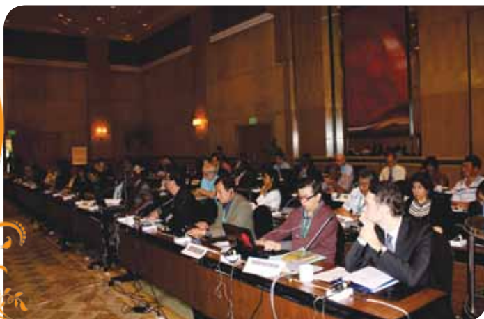
Зураг 71. Хуралдааны үеэр