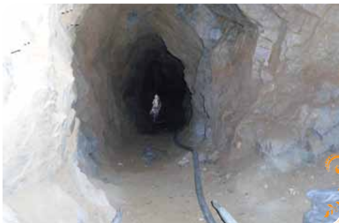
Зураг 6. Олборлолтын хэтээ ам гаргаж байгаа нь.

удирдлага, захиргааны байгууллагын төлөөллийг оролцуулан жил бүр зохион байгуулж хэвшсэн байна.