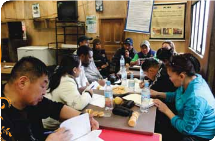
Зураг 84. Боливын бичил уурхайчдын Котапата хоршооны хамт олонтой уулзаж байгаа нь

Мөн аялалын хугацаанд ШХШО-ын дэмжлэг үзүүлэгч “Cumbre Del Sajama S.A” буюу “Сахама уулын оргил” байгууллагатай уулзалт хийж хэрхэн үйл ажиллагаа явуулдаг талаар асууж суралцав.