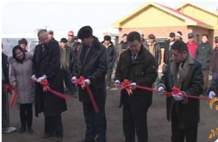
Зураг 23. Борнуурын хүдэр баяжуулах мөнгөн усгүй технологи бүхий цехийн нээлтийн ажиллагаа