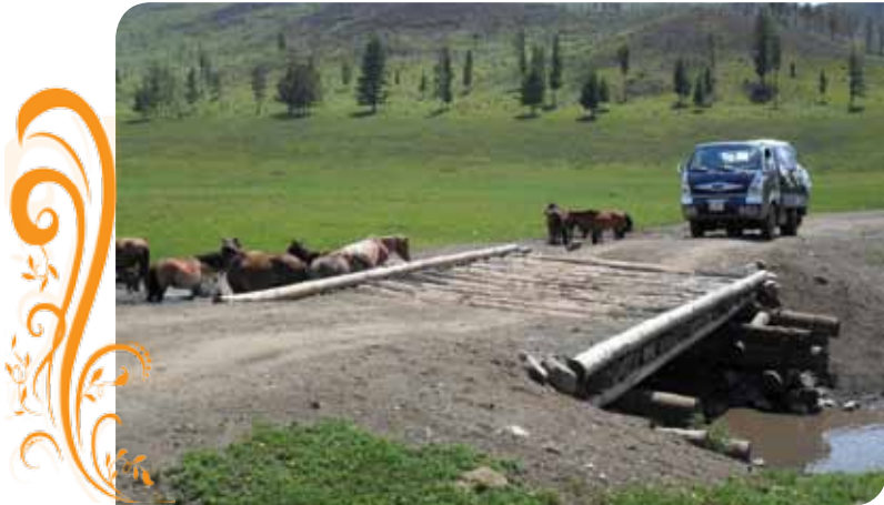
Зураг 8. Баатар вангийн хишиг холбоо ТББ-ын гишүүдийн зассан Хамар давааны гүүр

Орон нутгийн захиргаатай хамтран ажиллах талаар: Түнхэл тосгоны захирагчийн албаны 22 хүний бүрэлдэхүүнтэй баг хувиараа ашигт малтмал олборлогчдын ажлын байранд ирж ажил байдалтай нь танилцах зорилгоор 2 өдөр ажилласан нь хамтран ажиллах, харилцан ойлголцох эх үүсвэрийг тавьсан болно. Мөн орон нутгийн хэвлэл мэдээллийн байгууллагатай хамтран ажиллаж өөрсдийн үйл ажиллагаа, нөхцөл байдлын талаар орон нутгийн иргэдэд зөв ойлголт өгөх, хамтран ажиллах нөхцөл боллоцоог бүрдүүлж байна. Багийн иргэдийн нийтийн