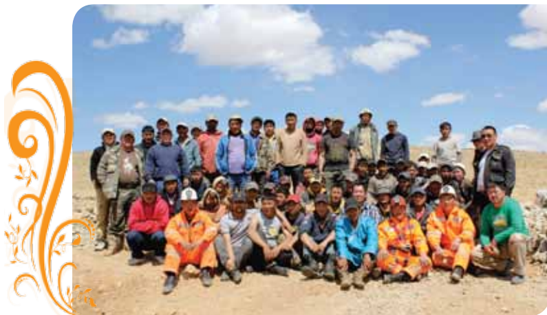
Зураг 36. ХАМОДХ ТББ-ын гишүүд

Удаан хугацааны турш олон дахин оролдсоны үр дүн, Баянхонгор аймгийн болон Баян-Овоо сумын удирдлагын дэмжлэгтэйгээр ХАМОДХ ТББ Спейшл майнз ХХК-д бичил