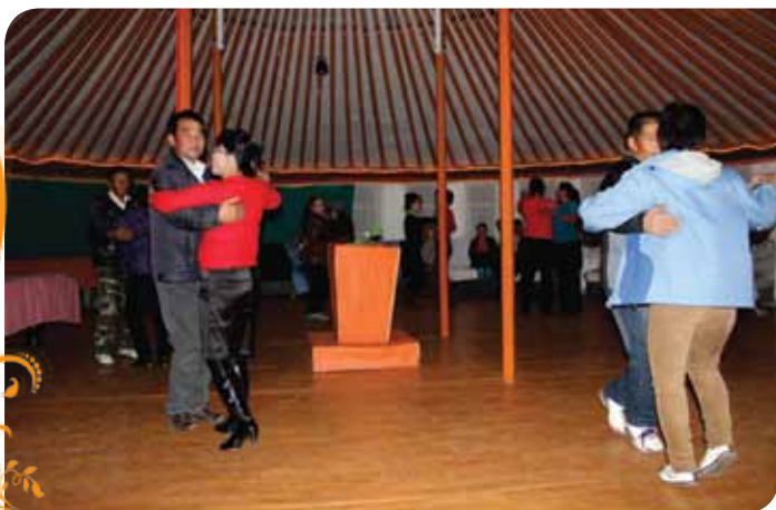
Зураг 99. Нийтийн бүжгийн тэмцээний үеэр