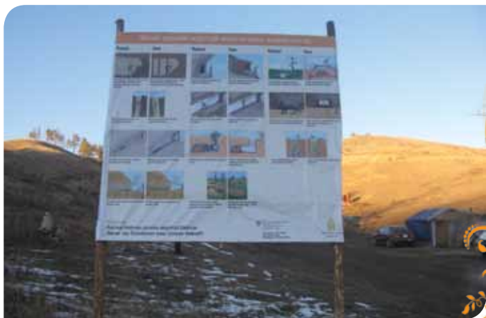
Зураг 4. ХАБ-ын самбар

байгуулсан бөгөөд тэднийг Уул Уурхайн Аврах Албаны сургалтын цогцолборт зохион байгуулдаг тусгай сургалтанд хамруулж, шаардлагатай тоног төхөөрөмжөөр ханган ажиллаж байна. Авран туслах баг нь тусгайлан гаргасан хуваарийн дагуу нөхөрлөлүүдийн аманд үзлэг шалгалт хийж зөвлөгөө өгч осол гэмтэл гарахаас урьдчилан сэргийлэх арга хэмжээ авч байна.