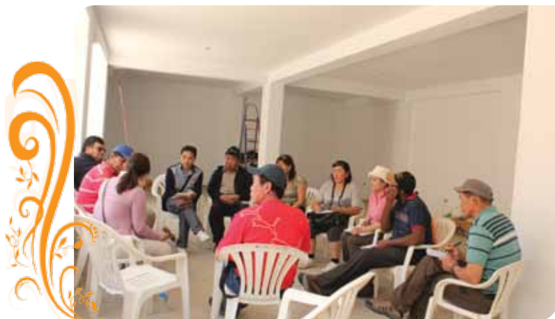
Зураг 87. Уулзалтын үеэр