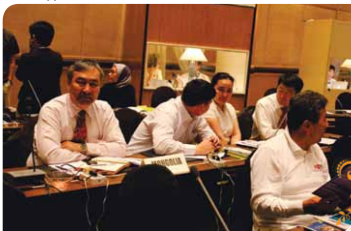
Зураг 69. Форумд оролцогчид

Монгол улсын бичил уурхайн хууль эрх зүйн орчны талаар танилцуулсан болно.