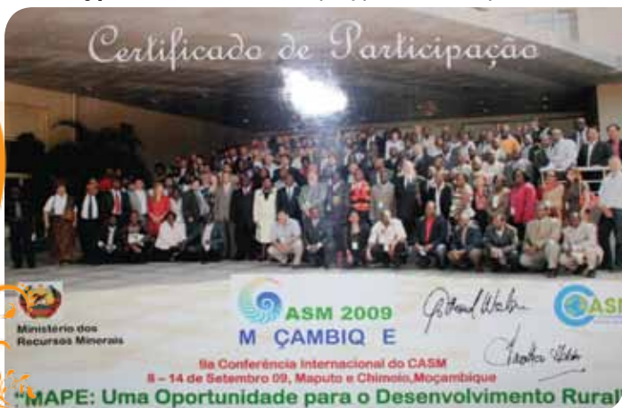
Зураг 66. 2009 онд Мозамбик улсад зохион байгуулсан CASM-ын 9-р хуралдаанд оролцогсод