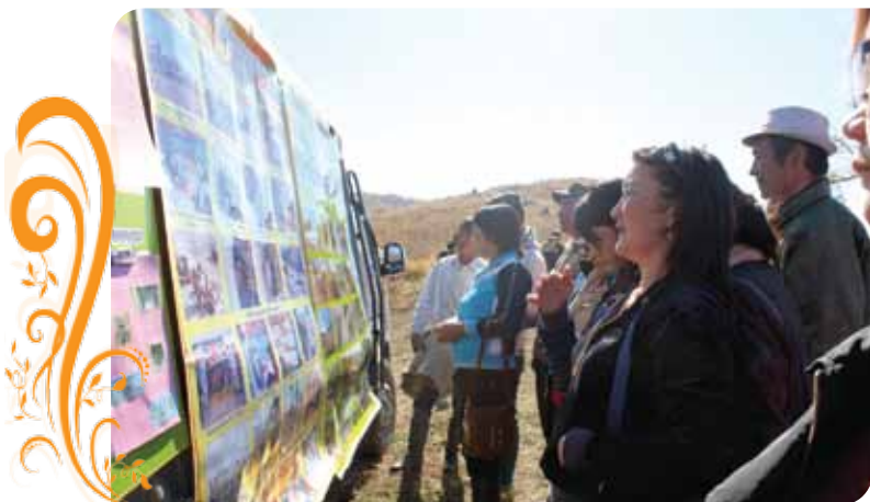
Зураг 95. Туршлага судлах аялалын үеэр бичил уурхайчид Баатар Вангийн хишиг холбоо ТББ-ын үйл ажиллагааны танилцуулгыг үзэж байгаа нь