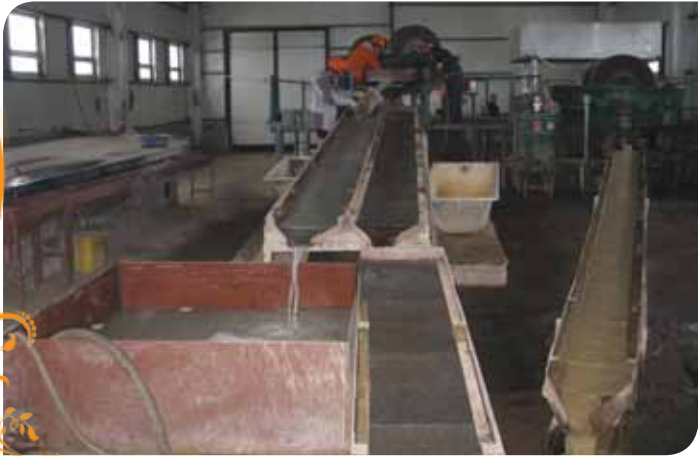
Зураг 25. Хүдэр баяжуулах цехийн технологийн шугамын туршилт хийж байгаа нь