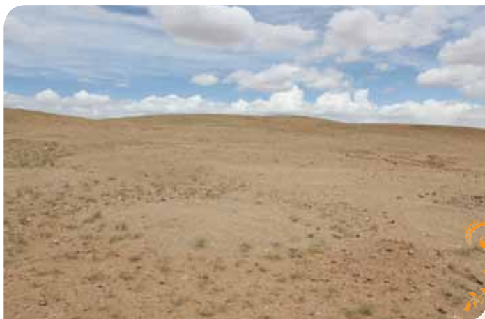
Зураг 2. Алтан ус-Аман ус ТББ-ын гишүүдийн гар аргаар техникийн нөхөн сэргээлт хийсэн талбай