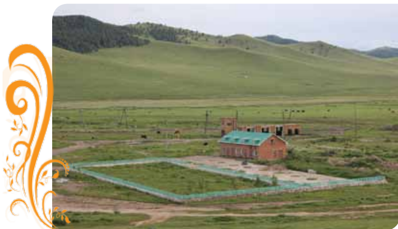
Зураг 29. ХАМО компаний зочид буудал

Мөнгөн усгүй технологи нь бодисын хүндийн жингийн үйлчлэл буюу дэлхийн таталтын зарчмыг үндэслэх бөгөөд хацарт бутлагч, дугуйт тээрэм, шлюзийн угсраа шугам, Holman сэгсрэгч ширээ зэрэг Монгол, Хятад, Англи, Бразил, Канад улсад үйлдвэрлэсэн гол тоног төхөөрөмжийг ашигладаг. ТБУТ-ийн инженер техникийн багийн туршилтын ажлын дүнг Улсын геологийн төв лабораториор баталгаажуулснаар энэхүү технологийн метал авалтын хэмжээг 70-80% байна гэж тодорхойлж баталгаажуулсан болно.