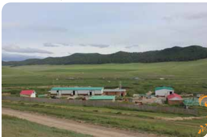
Зураг 24. Борнуурын хүдэр баяжуулах үйлдвэр

Туршилтын цехийг албан ёсоор ажиллуулж эхэлснээс хойших хугацаанд ХАМО компани бизнесийн үйл ажиллагаагаа өргөжүүлж баяжуулалтын долоон шугам ашиглалтанд оруулснаас гадна бичил уурхайчид, үйлчлүүлэгчдийн тав тухыг хангасан 30 хүн хүлээн авах хүчин чадалтай зочид буудал, 16 суудалтай хоолны газар байгуулж үйлчилж байна. ХАМО