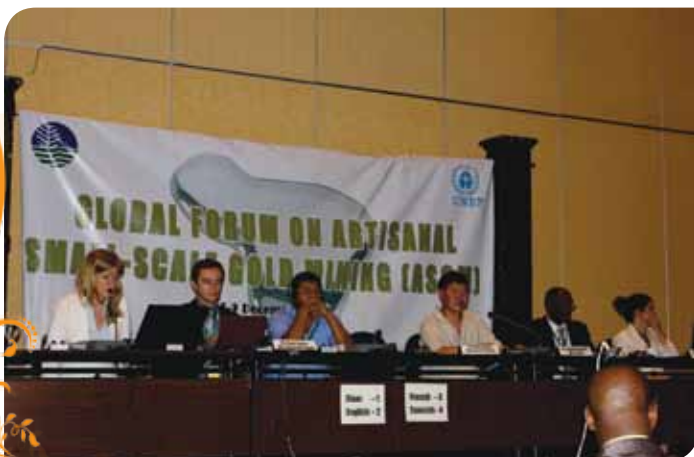
Зураг 67. Филиппин улсын нийслэл Манила хотод болсон олон улсын форумын үеэр