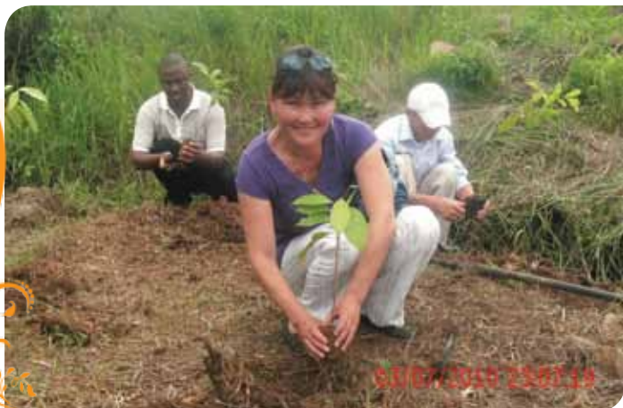
Зураг 79. Ирсэн зочдоор мод тариулдаг заншлын дагуу Монголын туршлага судлах багийн гишүүд мод тарьж байгаа нь