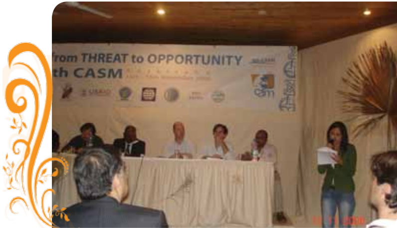
Зураг 58. 2006 онд зохион байгуулагдсан CASM-ын 6-р хуралдаанд оролцож байгаа нь

Олон улсын Бичил уурхайн нийгэмлэг нь жил бүр ээлжит чуулганаа хийж асуудлаа хэлэлцдэг бөгөөд тус нийгэмлэгийн Мадагаскар улсад зохион байгуулсан VI, Монгол улсад зохион байгуулсан VII, Бразил улсад зохион байгуулсан VIII, Мозамбик улсад зохион байгуулсан IX чуулганд Ази, Номхон далайн бичил уурхайн нийгэмлэгийн Монголын төлөөлөгч, бичил уурхайчдын болон ШХА-ийн төлөөлөл болон холбогдох яам агентлагийн хууль эрх зүй, техник технологи, байгаль орчны асуудал хариуцсан ажилтнууд оролцож санал бодлоо солилцон бусад орны туршлагаас суралцсан.