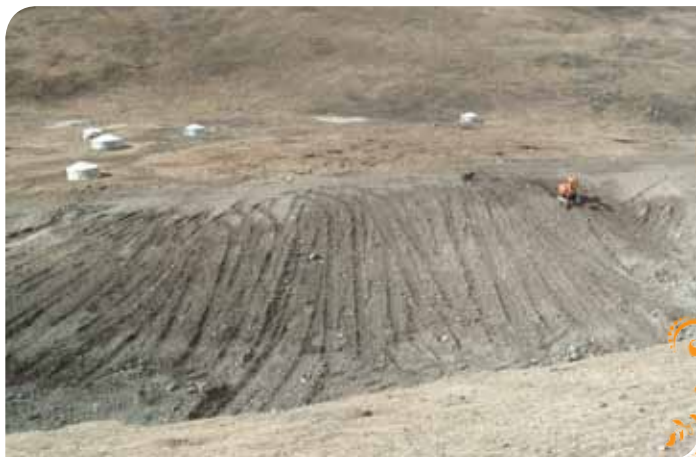
Зураг 12. Техникийн нөхөн сэргээлт хийж байгаа байдал

Бага оврын тракторыг техникийн нөхөн сэргээлт хийхэд ашигладаг болсноос гадна нөхөрлөлүүдийн хүсэлтээр тэдний олборлолт явуулах газрын өнгөн хөрсийг хуулах үйлчилгээ үзүүлдэг болсон бөгөөд энэ үйлчилгээнээс олсон орлогыг ТББ-ын дансанд хуримтлуулж тракторын урсгал засвар, үйлчилгээ, жолоочийн хөлс болон урьд нь гэмтсэн газарт нөхөн сэргээлт хийх зэрэг үйл ажиллагаанд зарцуулдаг болов. Ингэж ажилласны үр дүнд 2008 оноос хойш нийтдээ 10 га газарт техникийн нөхөн сэргээлт хийсэн байна.