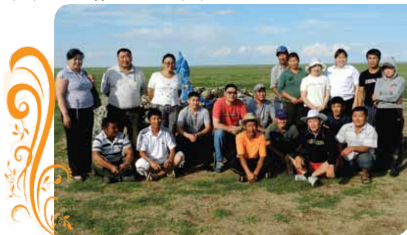
Зураг 51. ТББ-ын хүрээнд аймаг, сум орон нутгийн удирдлагууд, холбогдох албаны хүмүүстэй нягт холбоотой ажилладаг

Сум, орон нутгийн хэмжээнд байгууллага хамт олон, олон нийт бидний дуу хоолой, хөндсөн асуудлыг анхааран сонсож нухацтай хүлээн авч хамтарч ажиллах хүсэл сонирхолтой болсон байна. Манай ТББ сумын хэмжээнд үйл ажиллагаа явуулдаг байгууллагуудын сар бүрийн нэгдсэн хуралдаанд албан ёсоор оролцдог бөгөөд уг хуралдааны үеэр байгууллагын үйл ажиллагаа, төлөвлөгөө, ололт амжилт болон тулгарч байгаа хүндрэлтэй асуудлын талаар ярилцдаг юм.