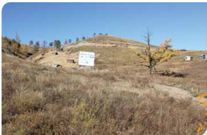
Зураг 3. Баатар вангийн хишиг холбоо ТББ-ын гишүүдийн олборлолтын талбай

байгуулсан бөгөөд тэднийг Уул Уурхайн Аврах Албаны сургалтын цогцолборт зохион байгуулдаг тусгай сургалтанд хамруулж, шаардлагатай тоног төхөөрөмжөөр ханган ажиллаж байна. Авран туслах баг нь тусгайлан гаргасан хуваарийн дагуу нөхөрлөлүүдийн аманд үзлэг шалгалт хийж зөвлөгөө өгч осол гэмтэл гарахаас урьдчилан сэргийлэх арга хэмжээ авч байна.