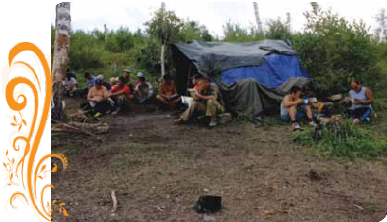
Зураг 32. Дууш мандал хайрхан холбоо ТББ-ын гишүүд БУ-н холбогдолтой материалыг судалж байгаа нь

Олборлолтын газрын асуудлыг шийдвэрлэх талаар: Мандал сумын ИТХ-ын 2012 оны 3-р сарын 19-ны 07 тоот тогтоолоор “Ноёт”-ын 12.29 га талбайг орон нутгийн тусгай хэрэгцээнд авч Ашигт малтмалын газрын Уул уурхайн судалгааны хэлтсийн даргын 2012 оны 4-р сарын 25-ны өдрийн 5/2563 тоот албан бичгээр бичил уурхайн зориулалтаар ашиглаж болох дүгнэлт гарч олборлолтын газрын асуудал албан ёсоор шийдэгдлээ. Одоо ТББ-ын зүгээс гишүүдээ шинэчилсэн бүртгэлд оруулах, нөхөрлөлүүдийн зохион байгуулалтыг сайжруулах, бичиг баримтыг шинэчлэн бүрдүүлэх ажил хийж байгаа бөгөөд сумын Засаг даргатай Бичил уурхайн үйл ажиллагааг зохицуулах журмын дагуу хамтран ажиллах гэрээ байгуулахаар ажиллаж байна.