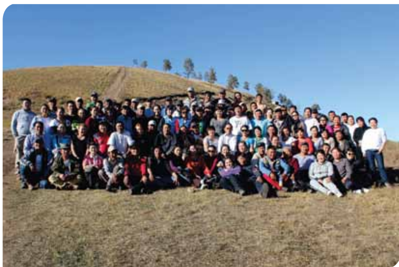
Зураг 88. Туршлага судлах аялалд 11 аймгийн 14 сумын бичил уурхайчдын төлөөлөл оролцов

Баатар вангийн хишиг холбоо ТББ-ын туршлагаас суралцах аялал Сэлэнгэ аймаг, Мандал сум, Дунд буданчийн ам 2012 оны 10 сарын 5