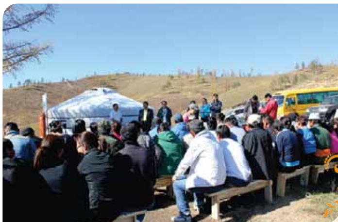
Зураг 89. Туршлага судлах аялалын нээлтийн ажиллагаа