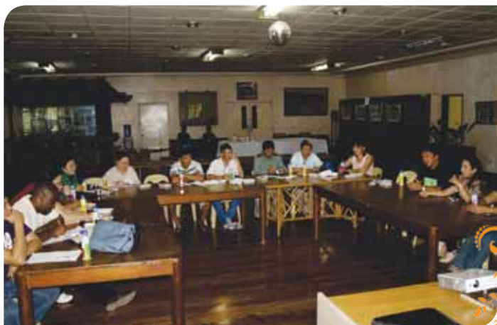
Зураг 76. Уул уурхайн том компани болон орон нутгийн хамтын ажиллагааны талаар “Zambales Diversified Metals Corp.” буюу Замбалесын металлын корпорацийн туршлагаас суралцаж байгаа нь