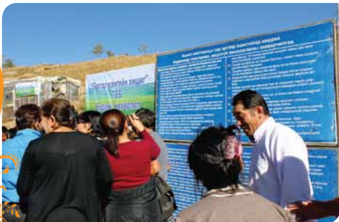
Зураг 92. Туршлага судлах аялалын үеэр бичил уурхайчид олборлолтын амны зохион байгуулалттай танилцаж байгаа нь