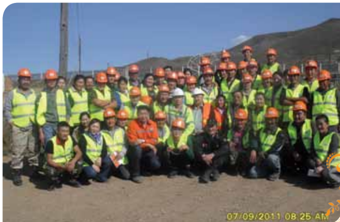
Зураг 44. Энх мөнх эргэх холбоо ТББ-ын гишүүд Мондулаан компаний инженер, техникийн ажилчдын хамт

Гурван талт гэрээ байгуулж ажиллах талаар: Аливаа бичил уурхайчдын үйл ажиллагаанд нийтлэг тулгардаг хүндрэлтэй асуудлын нэг болох газрын асуудал манай ТББ-ын гишүүдийн өмнө тулгарсан хамгийн хүндрэлтэй асуудал байв. Энэ асуудлыг шийдвэрлэх зохистой арга замыг хайж цуцалтгүй ажилласны үр дүнд манай ТББ Заамар сумын нутаг дэвсгэрт үйл ажиллагаа явуулдаг уул уурхайн компаниудтай Бичил уурхайгаар ашигт малтмал олборлох үйл ажиллагааг зохицуулах журмын дагуу гурвалсан гэрээ байгуулах боломж байгааг олж харж холбогдох байгууллагууд, “Шижир алт”, “ХОТУ”, “Мондулаан трейд” ХХК зэрэг уул уурхайн компаниудад хандсан. Ийнхүү ажиллах хугацаанд Заамар сумын ЗД, ТБУТ-тэй