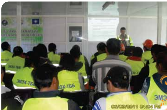
Зураг 45. Мондулаан компани ХХАА болон нийгмийн чиглэлийн сургалт зохион байгуулдаг