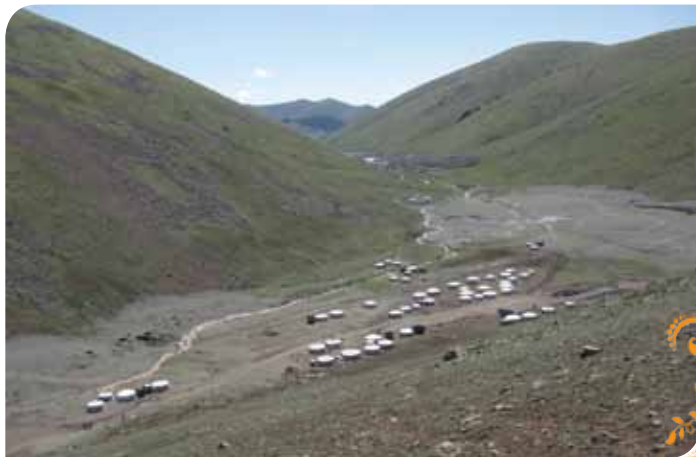
Зураг 10. Байдрагийн хөгжил ТББ-ын гишүүдийн байршил.

ын гишүүд, бичил уурхайчдын мэдлэг чадварыг дээшлүүлэх, чадавх суулгах төрөл бүрийн сургалт семинарт хамруулж эхэллээ.