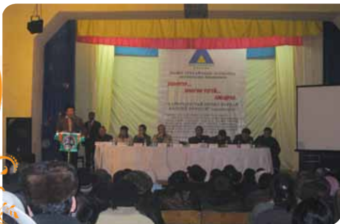
Зураг 21. Борнуур, “Мөнгөн усгүй амьдрал” зөвлөлгөөн

болгож байгаа ажлын байрыг хүлээн зөвшөөрч дэмжиж албан болгох тухай” уриалга гаргаж оролцогчид бүрэн дэмжив. Мөн зөвлөлгөөний үед БУХ ТББ-аас санаачлан боловсруулсан “Алтны хүдэр боловсруулах үйлдвэрлэл, бичил уурхайн менежмент” төслийг зөвлөлгөөнд оролцсон нийт төлөөлөгчдөд дэлгэрэнгүй танилцуулсан. ЗГХЭГ мөнгөн усгүй хүдэр баяжуулах саналыг дэмжихээ илэрхийлж зээл хэлбэрээр санхүүгийн дэмжлэг үзүүлэх боломжтойг мэдэгдсэн. ШХА бичил уурхайгаас хөдөөгийн хөгжилд оруулж байгаа эерэг нөлөөллийг дэмжин хөгжүүлэх, загвар үйл ажиллагаа явуулах санаачлагыг халуунаар дэмжиж байгаагаа илэрхийлж техник технологийн болон бусад шаардагдах дэмжлэг туслалцааг үзүүлэхээ мэдэгдсэн юм.