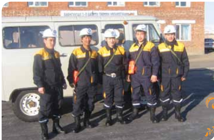
Зураг 35. Авран туслах багийн гишүүд

Авран туслах баг Уул уурхайн аврах ажиллагаа-2010 тэмцээнд амжилттай оролцсон бөгөөд авран туслах багийн гишүүд УУАА-наас зохион байгуулдаг сургалтанд тогтмол хамрагдаж мэдлэг чадвараа дээшлүүлж байна.