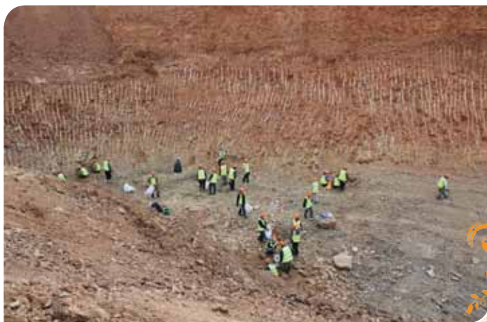
Зураг 46. Олборлолтын үеэр

Энэ хугацаанд бид нийтдээ 1,931.42 гр алт олборлож 89,465.800 төгрөгийн орлого олсон бөгөөд нөөцийн болон компаний татварт 32,301.260 төгрөгийг тушаасан. Мөн ТББ-ын гишүүд эрүүл мэнд, нийгмийн даатгалд хамрагдаж хүн амын орлогын албан татвар төлж байна.