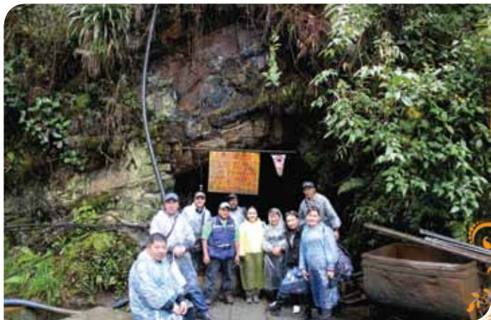
Зураг 83. Котапата уурхайд

авсан Котапата хоршооны хамт олонтой уулзаж олборлолтын газарт зочилж зохион байгуулалт, бэлтгэл, хүндрэлтэй асуудлууд, түүнийг даван туулах арга зам, тэр бүхний эцэст ирэх боломж болон ашиг тусын талаар судалж суралцах завшаан тохиосон юм.