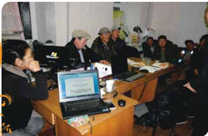
Зураг 57. Говь нутгийн чулуу хоршооны анхны хурлын үеэр