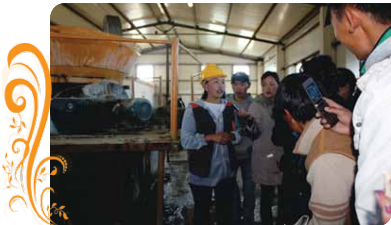
Зураг 96. Туршлага судлах аялалын багийнхан Төв аймгийн Борнуур сумын мөнгөн усгүй технологиор хүдэр баяжуулах цехийн үйл ажиллагаатай танилцав