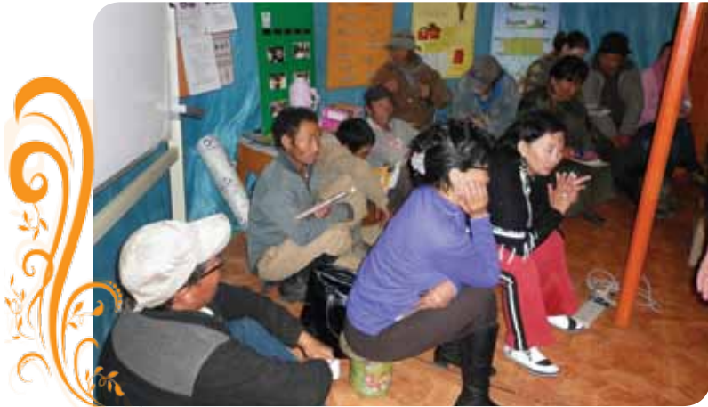
Зураг 16. Батсайхан сэтгэл ТББ-ын гишүүд олон нийтийг хамарсан үйл ажиллагаанд идэвхтэй оролцдог.

Сумын нутаг дэвсгэрт үйл ажиллагаа явуулдаг орон нутгийн уул уурхайн “Хөх тэнгэрийн зам” компанитай гэрээ байгуулан зөвшөөрөл бүхий талбайд нь нөхөрлөлүүд олборлолтын ажиллагаа явуулдаг болов.