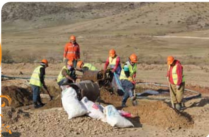
Зураг 47. Баяжуулалтын хэсэг

Гурвалсан гэрээ байгуулж ажиллахад Заамар сумын ЗД, Хайлааст 3-р багийн ЗД, байгаль орчны байцаагч нар дэмжлэг үзүүлж энэхүү гэрээний хүрээнд явуулж байгаа үйл ажиллагааг бодит үр дүнтэй болгохыг эрмэлзэж байв.