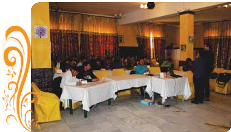
Зураг 38. БУ-р олборлосон алтны ШХШО-ын стандартын талаар зөвлөх Феликс Хрушка семинар зохион байгуулж байна

Алтны шударга худалдаа, шударга олборлолтын стандартын системийн чиглэлээр ТБУТ-ийн олон улсын зөвлөх бөгөөд ШХШО-ын стандартыг санаачлагч ARM/FLO-ын төлөөлөл ноён Феликс Хрушкатай нягт холбоотой ажилладаг.