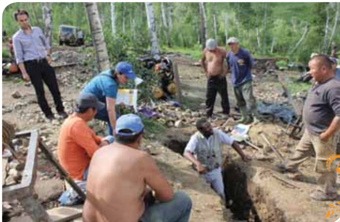
Зураг 33. Олборлолтын газрын зохион байгуулалтын талаар ярилцаж байна.

ТББ-ын дэргэдэх эмэгтэйчүүдийн зөвлөл бичил уурхайчин эмэгтэйчүүдийн эрүүл мэндийг хамгаалах чиглэлээр төрөл бүрийн үйл ажиллагаа явуулдагийн нэг нь бичил уурхайчин эмэгтэйчүүдийг сумын эмнэлгийн эмэгтэйчүүдийн их эмчийн үзлэгт тогтмол оруулж зөвлөгөө авч ярилцлага, уулзалт хийж хэвшсэн явдал юм.