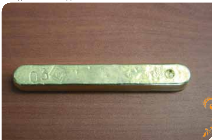
Зураг 31. ХАМО компани баяжуулсан алтаа Монгол банкнд тушааж байна

ХАМО ХХК-ийн хамт олон “Хөдөө нутгийн хөгжлийн боломж, иргэдийн бүтээлч чадварыг хөдөлмөр бүтээлээр нотлон харуулна” гэсэн эрхэм зорилготой ажиллаж байгалийн нөөц баялгийг бүтээн байгуулалт, ажлын тогтвортой байр бий болгоход зориулан ашиглаж байна.