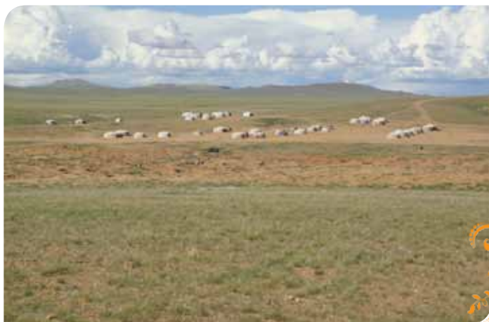
Зураг 1. Алтан ус-Аман ус ТББ-ын гишүүдийн суурьшлын бүс болон олборлолтын талбай