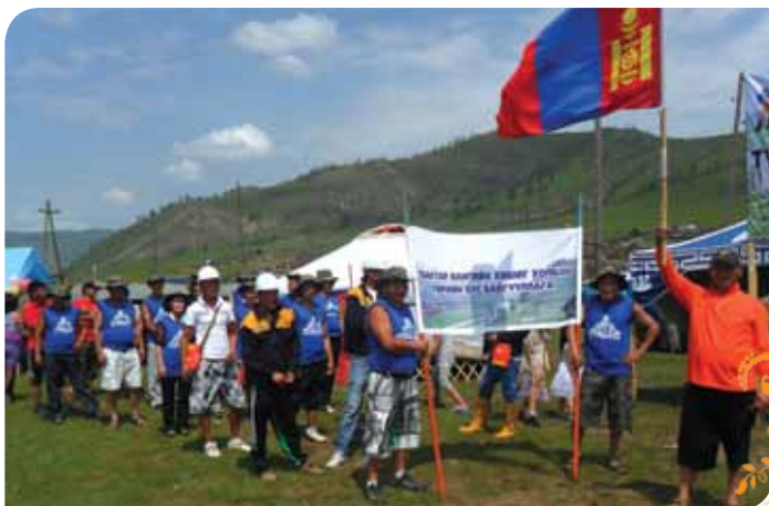
Зураг 7. Баатар вангийн хишиг холбоо ТББ-ын гишүүд орон нутгийн наадмаар жагсаж байгаа нь.

2012 оны Улсын баяр наадмаар байгууллагаараа хүндэтгэлийн жагсаал хийж нутгийн иргэдийг идэвхжүүлж баяр наадмын өнгийг сайжруулав.