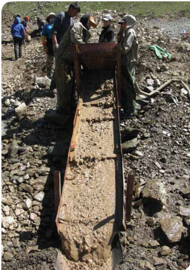
Зураг 11. Өндөр хүчин чадалтай усан баяжуулалтын төхөөрөмж туршиж байгаа нь.