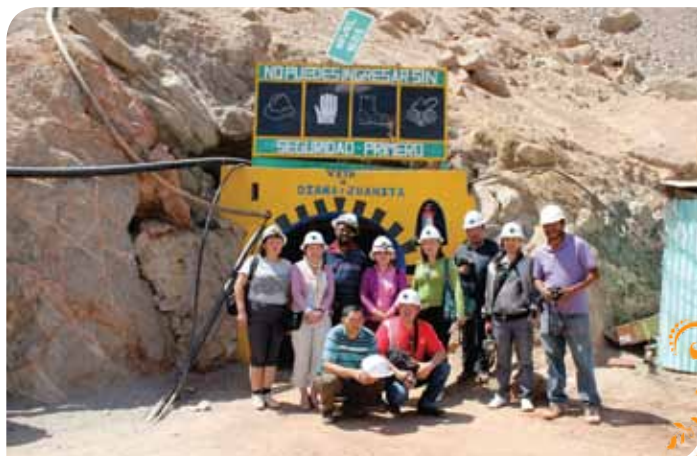
Зураг 86. Перугийн уурхайд