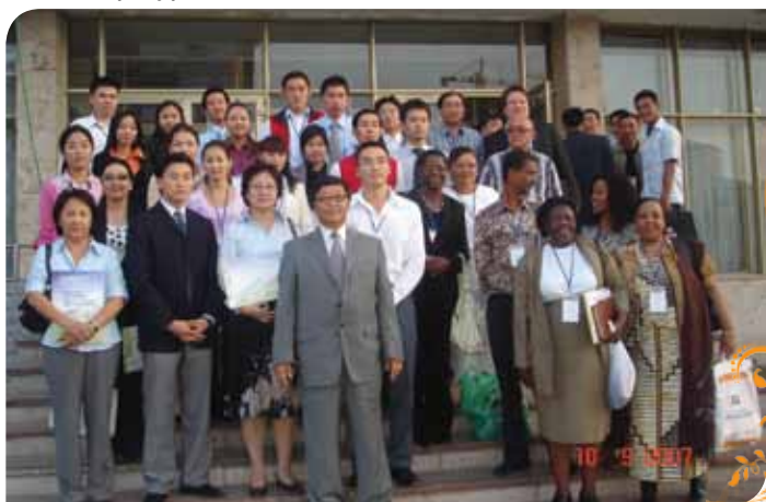
Зураг 60. CASM-ын 7-р хуралдааныг Улаанбаатарт зохион байгуулав