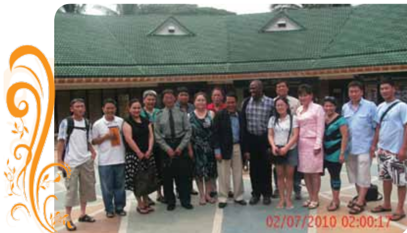
Зураг 75. Аялалын багийнхан Филиппин улсын Уул уурхайн яамны Эрчим хүч, байгалийн баялгийн газрын дарга болон холбогдох албаны хүмүүстэй уулзсан уулзалтын дараа

Туршлага судлах аялалын хүрээнд доорх чиглэлээр сайн туршлагуудыг судалж бичил уурхайчдын олборлолтын газраар зочилсон. Үүнд: