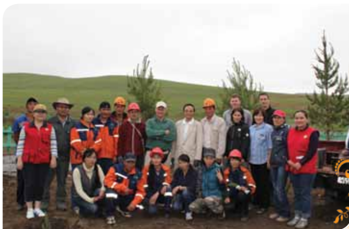
Зураг 30. ХАМО компаний эзэмшил газарт цэцэрлэгт хүрээлэн байгуулах ажлын эхлэлийг тавив