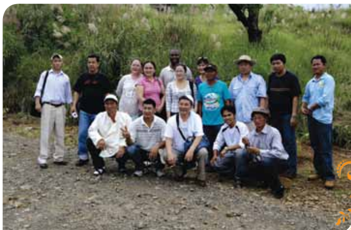
Зураг 80. Туршлага судлах багийн гишүүд