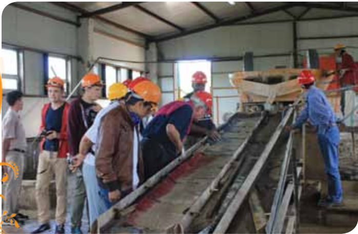
Зураг 26. ШХА-ийн Ерөнхий захирал Мартин Дахиндэн мөнгөн усгүй технологи бүхий хүдэр баяжуулах цехийн үйл ажиллагаатай танилцаж байгаа нь

компани байнгын 60 ажлын байр бий болгож Борнуур суман дахь хамгийн том объект болж өргөжснөөр орон нутгийн иргэдийн амьжиргааны түвшинг дээшлүүлэх, нийгэм, эдийн засгийн хөгжилд бодит хувь нэмэр оруулж байна.