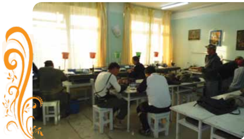
Зураг 54. Бичил уурхайчдад чулуугаар бүтээгдэхүүн үйлдвэрлэх ур чадвар олгох сургалтын үеэр

тусламж дэмжлэг авахаар орон нутгийн захиргаа болон ШХА /ТБУТ-д хандсаныг нааштайгаар хүлээн авч дэмжлэг үзүүлэхээр болсон. Энэ ажлын хүрээнд бид хэрэгцээ шаардлага, зах зээл, тоног төхөөрөмж, орон нутагт байгуулах боломж бололцооны талаар судалгаа хийсний дараа цех байгуулах ажлыг эхлүүлээд байна.