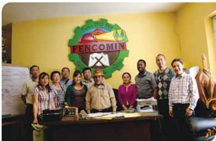
Зураг 82. Аялалын багийнхан Боливын бичил уурхайчдын нэгдсэн Фенкомин холбооны ерөнхийлөгчтэй уулзах үеэр

авсан Котапата хоршооны хамт олонтой уулзаж олборлолтын газарт зочилж зохион байгуулалт, бэлтгэл, хүндрэлтэй асуудлууд, түүнийг даван туулах арга зам, тэр бүхний эцэст ирэх боломж болон ашиг тусын талаар судалж суралцах завшаан тохиосон юм.