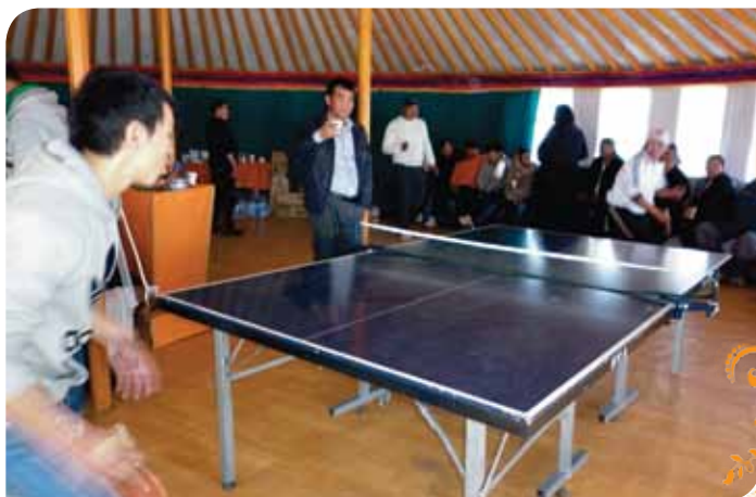
Зураг 101. Ширээний теннисний тэмцээн