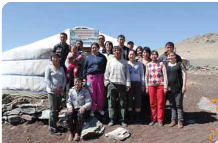
Зураг 15. Батсайхан сэтгэл ТББ-ын хэсэг гишүүд

Бидний зорилго бол тархай бутархай байсан иргэдийг нэгтгэн, нэгэн санаа зорилготой, байгальд хал багатай олборлолтын ажиллагаа явуулж, байгальтай зөв боловсон харьцах, хамт олноороо баг болон ажиллах, эмэгтэйчүүдийн оролцоо, хөдөлмөр хуваарилалтыг шударга зохион байгуулах, гишүүдийн гэр бүлийн дарамт түгшүүрийг багасгах, орон нутгийн иргэдийн хоорондын харилцаа итгэлцлийг нэмэгдүүлэх, гишүүн бүр хөдөлмөрийн хөлсөө шударга хуваарилахад оршиж байгаа юм.