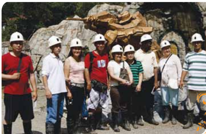
Зураг 77. Бэнэуэтийн уурхайд