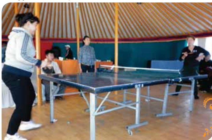
Зураг 102. Ширээний теннисний тэмцээн