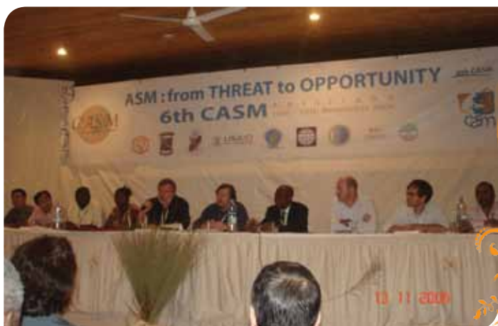
Зураг 59. 2006 онд зохион байгуулагдсан CASM-ын 6-р хуралдаан