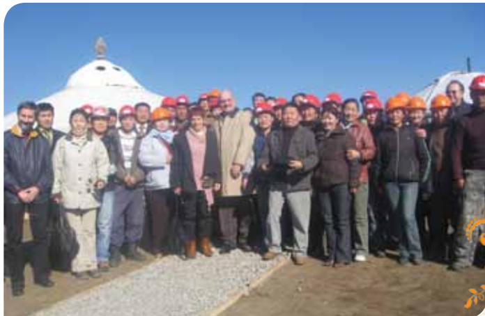
Зураг 22. Таван талт гэрээнд гарын үсэг зурах үеэр

Энэхүү таван талт гэрээний гол үр дүн нь Сүжигт уулын орчигдсон уурхай орчмын 58 га талбайг Борнуурын бичил уурхайчдын нөхөрлөлүүд тусгай зөвшөөрөл эзэмшигчийн зөвшөөрөлтэйгээр ашиглах албан ёсны харилцааг баталгаажуулсан явдал болов.