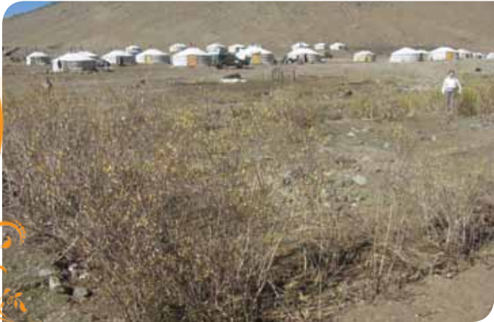
Зураг 13. Байдрагийн хөгжил ТББ-ын гишүүдийн байгуулсан чацарганы төгөл

Жаргалант сумын бичил уурхайчид болон иргэдийн ариун цэвэр, эрүүл ахуйн нөхцлийг сайжруулах зорилгоор сумын захиргаа, бичил уурхайчдын ТББ ТБУТ-ийн дэмжлэгтэйгээр сумын нийтийн халуун усны газар барьж байгуулав.