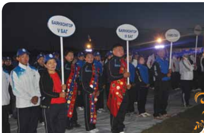
Зураг 41. Бага олимпийн нээлтийн ажиллагаа

Тэмцээнд ХАМОДХ ТББ-н баг тамирчид амжилттай оролцож дараах байруудыг эзэлсэн. Үүнд: