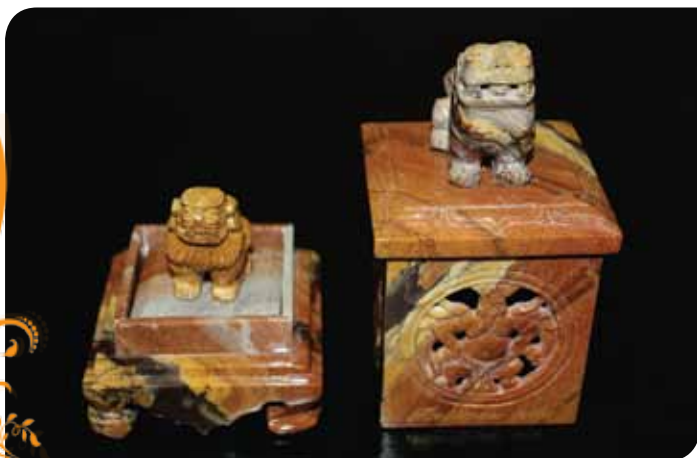
Зураг 56. Бичил уурхайчдын хийсэн бүтээгдэхүүн