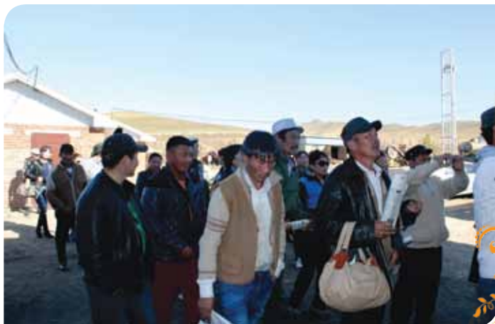
Зураг 98. Туршлага судлах аялалын багийнхан Төв аймгийн Борнуур сумын мөнгөн усгүй технологиор хүдэр баяжуулах цехийн үйл ажиллагаатай танилцав