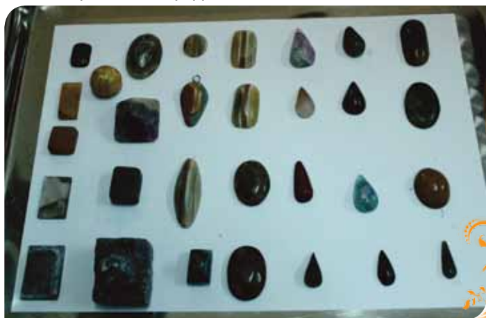
Зураг 55. Ур чадварын сургалтын үеэр хийсэн бүтээгдэхүүн

ТБУТ-ийн зүгээс бичил уурхайчдын чулуугаар гар урлалын бүтээгдэхүүн үйлдвэрлэх ур чадварыг хөгжүүлэх сургалтанд хамруулах, шаардлагатай судалгаа хийх, онол арга зүйн зөвлөх үйлчилгээгээр хангах, тоног төхөөрөмж нийлүүлэх, цех байгуулах чиглэлээр дэмжлэг үзүүлж байна.