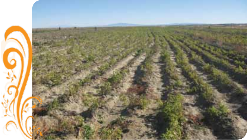
Зураг 18. Баянбөмбөгөр ТББ-ын ногооны талбай

Бөмбөгөр сумын ЗД, ШХА/ТБУТ-ийн дэмжлэгтэйгээр төмс, хүнсний ногоо тарих 3 га талбайг 3-р багийн нутаг Бор толгой гэдэг газар хашин хамгаалж, ногоо тарьснаар сумын иргэдийг хүнсний ногоогоор хангадаг болсоноос гадна сумын төвд ногоо хадгалах зоорь барив.