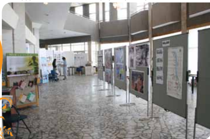
Зураг 62. CASM-ын 7-р хуралдааны үзэсгэлэнгийн хэсгээс