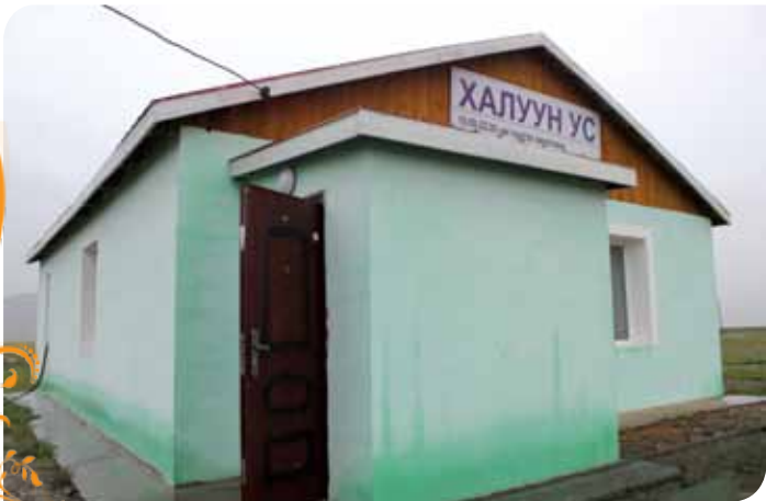
Зураг 14. Жаргалант сумын нийтийн халуун усны газар

Жаргалант сумын бичил уурхайчид болон иргэдийн ариун цэвэр, эрүүл ахуйн нөхцлийг сайжруулах зорилгоор сумын захиргаа, бичил уурхайчдын ТББ ТБУТ-ийн дэмжлэгтэйгээр сумын нийтийн халуун усны газар барьж байгуулав.