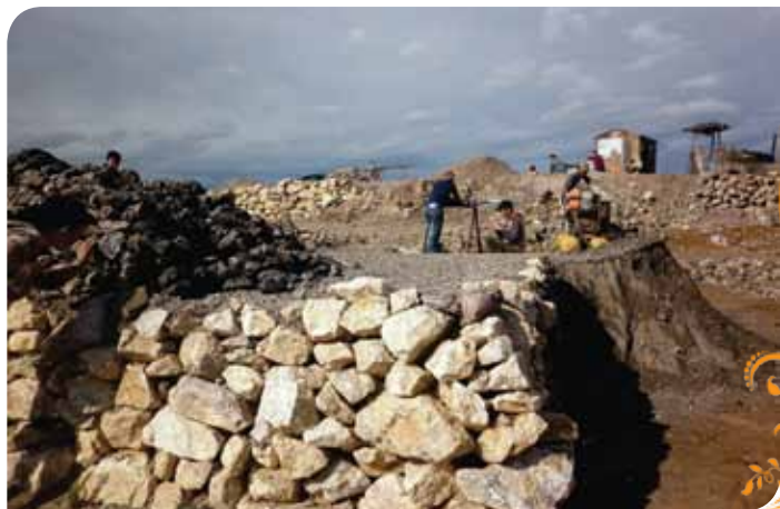
Зураг 53. Жоншны бичил уурхайчдын олборлолтын газар

Гар урлалын цех. Жонш, өнгөт чулуу болон Айраг сумын нутаг дэвсгэрт элбэг байдаг байгалийн чулуугаар гар урлал, бэлэг дурсгалын зүйл хийх, нэмүү өртөг шингэсэн бүтээгдэхүүн үйлдвэрлэх зориулалттай жижиг цех байгуулах санаачлагыг 2010 онд гаргасан бөгөөд энэхүү санаачлагыг хэрэгжүүлэхэд