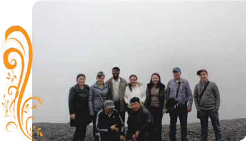
Зураг 81. Перу, Болив улсын бичил уурхайчдын байгууллагын туршлагаас судлах аялалын баг

холбоо, Хувиараа ашигт малтмал олборлогчдыг дэмжих холбоо зэрэг бичил уурхайчдын ТББ-ын төлөөлөл, ТБУТ-ын төлөөлөл оролцов.