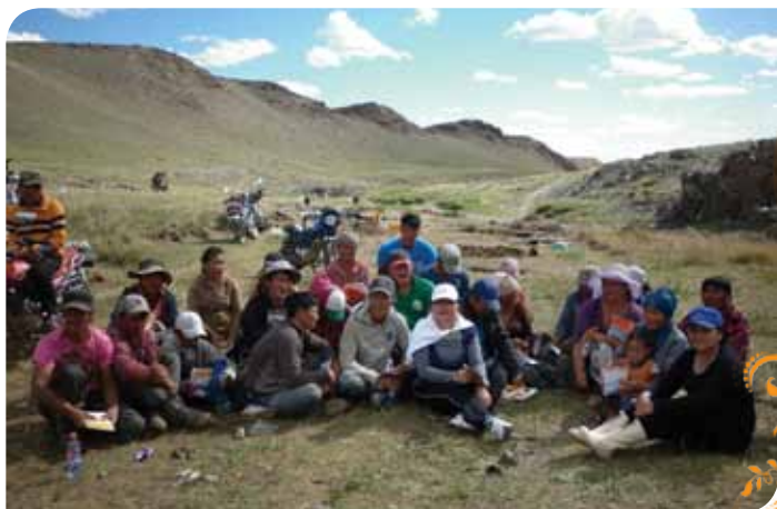
Зураг 20. Баянбөмбөгөр ТББ-ын гишүүд сургалтын дараа

холбогдох, архидаг согтуурах явдал арилсан бөгөөд орчин тойрны ариун цэвэр сайжирч, байгаль орчинд сөрөг нөлөө багатай аргаар олборлолт явуулдаг боллоо.