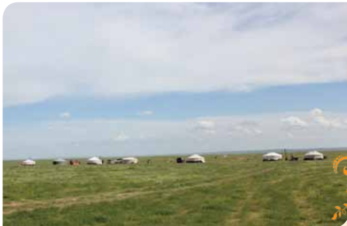
Зураг 50. Айраг сумын өнгөт чулуу олборлогч бичил уурхайчдын олборлолтын газар

Бичил уурхайчдын нөхөрлөлүүд ТББ-д нэгдэн орж дуу хоолойгоо нэгтгэснээр тэдний өмнө тулгарч байгаа нийтлэг асуудлууд, тухайлбал олборлолтын газрын зөвшөөрөл, хөдөлмөр хамгаалал, аюулгүй ажиллагаа, жоншны борлуулалт зах зээл, дотоод зохион байгуулалт, орон нутгийн хэмжээнд