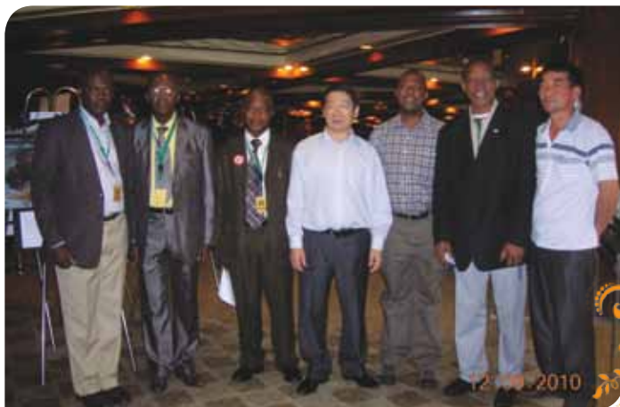
Зураг 70. Форумд оролцогчид бусад орны төлөөлөгчдийн хамт