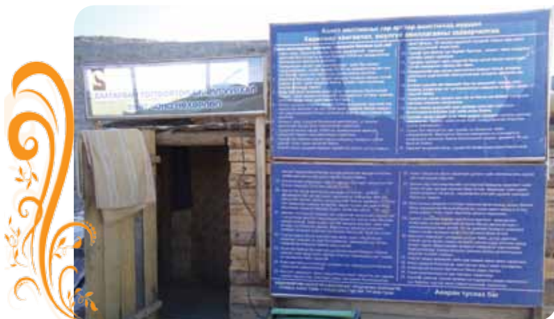
Зураг 5. Нөхөрлөлийн олборлолтын ам

2012 онд ТБУТ-ын дэмжлэгтэйгээр бичил уурхайчдын байгууллагын жижиг төсөл хэрэгжүүлэх хөтөлбөрийн хүрээнд олборлолтын үйл ажиллагаа явуулдаг Бор толгойн 8 га газарт техникийн нөхөн сэргээлт хийж ашигладаггүй маш олон ам, нүхийг булж тэгшлэн, ажиллах орчноо ая тухтай болгов. Энэ ажилд зэрэгцэн үйл ажиллагаа явуулдаг Пураам компаниас машин техникийн тусламж авч хамтарч ажилласан болно.