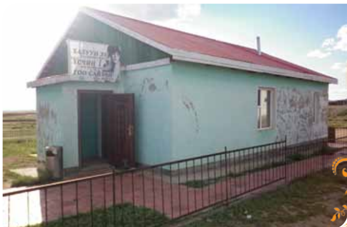
Зураг 19. Бөмбөгөр сумын халуун усны байр

холбогдох, архидаг согтуурах явдал арилсан бөгөөд орчин тойрны ариун цэвэр сайжирч, байгаль орчинд сөрөг нөлөө багатай аргаар олборлолт явуулдаг боллоо.