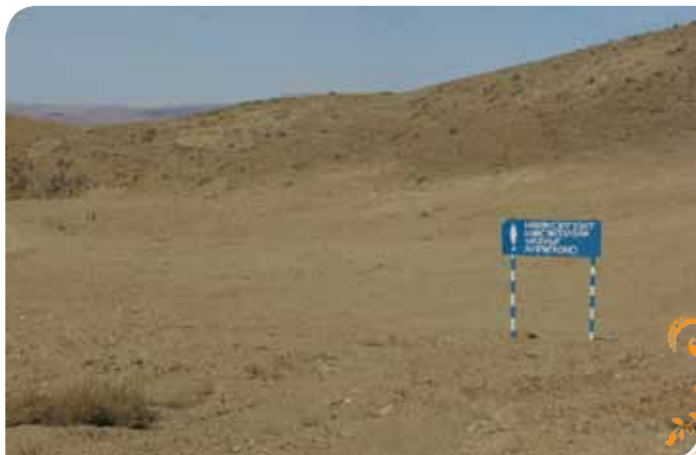
Зураг 17. Баянбөмбөгөр ТББ-ын гишүүдийн техникийн нөхөн сэргээлт хийсэн талбай.

Орон нутгийн захиргаа, удирдлагатай нягт холбоотой ажиллаж 2009 онд Буйлсанд 4 га талбай, 2010 онд Өөхтөд 2 га талбайг бичил уурхайчид үйл ажиллагаа явуулахыг зөвшөөрсөн шийдвэрийг сумын ИТХ-аар гаргуулсны дагуу ТББ-ын гишүүд үйл ажиллагаагаа зохион байгуулалттайгаар явуулах нөхцөл боломжийг бүрдүүлсэн. Мөн түүнчлэн ТББ-аас бичил уурхайчдын нөхөн сэргээлтийн ажлыг дэмжих зорилгоор өгсөн жижиг оврын тракторыг ашиглан олборлолт хийж дууссан 6 га талбайд өөрсдийн нөөц бололцоонд тулгуурлан техникийн нөхөн сэргээлтийг хийж сумын ЗДТГ, ИТХ, БОА-нд хүлээлгэн өгч дүгнэлтийг гаргуулав.