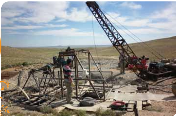
Зураг 40. Уурхайн гүнээс хүдэр гаргах зориулалттай механикжсан тайл

үр ашгийг нэмэгдүүлж цаг хэмнэх боломжтой болов. Агааржуулалтын төхөөрөмжийг сайжруулж бүрэн гүйцэд ашигласнаар уурхайн гүнд агааргүй болж осол гэмтэл үүсэхээс урьдчилан сэргийлж байна.