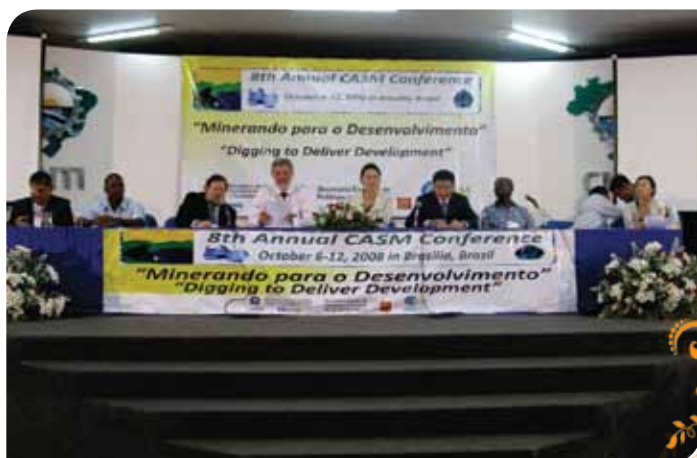
Зураг 63. 2008 онд Бразил улсад зохион байгуулсан CASM-ын 8-р хуралдаанд оролцож байгаа нь